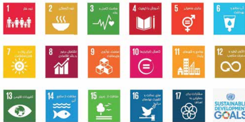
شکل ۱- اهداف ۱۷ گانه توسعه پایدار