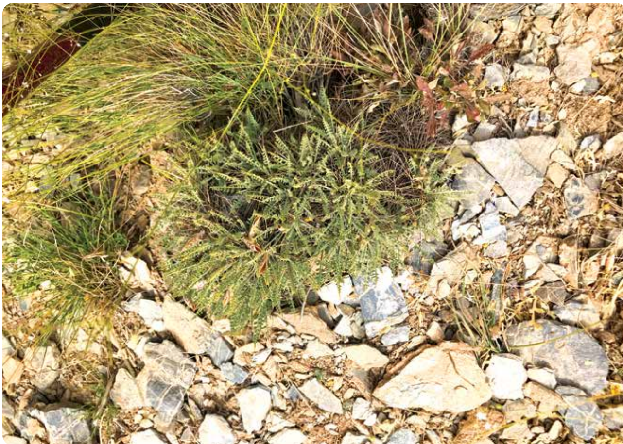
شکل ۲- گونه Astragalus ovigerus شکل کلی گیاه

گیاهی نیمه‌چوبی، پاکوتاه، خارپشتی به ارتفاع ۱۵ تا ۳۰ سانتی‌متر در قاعده منشعب. پایه گیاه پوشیده از کرک‌های ساده کوتاه و پهن سفید در مجاورت گل‌آذین، که با کرک‌های سیاه ترکیب می‌شود. ساقه‌ها کوتاه با کرک‌های خوابیده یا به تدریج کم‌کرک‌شونده. گوشواره‌ها سخت و زرد، تخم‌مرغی پهن، نوک تیز، با کرک‌های خوابیده مترکم. برگ‌ها به طول ۲ تا ۹ سانتی‌متر، محور اصلی برگ‌ها سخت یا ضخیم با کرک‌های خوابیده. برگچه‌ها ۷ تا ۱۰ جفت، مسطح، تخم‌مرغی باریک یا واژتخم‌مرغی. دمگل آذین به طول ۱ تا ۳ سانتی‌متر با کرک‌های مترکم و خوشه تنک با ۱