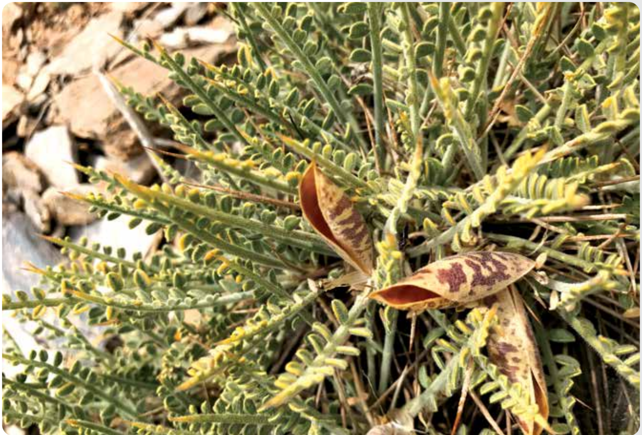
شکل ۳- گونه Astragalus ovigerus شاخه‌های برگ‌دار و میوه‌ها

پیمایش در رویشگاه مشاهده‌شده آن در منطقه فریدن اصفهان بررسی و حدود ۲ کیلومتر مربع تخمین زده شد. ذکر این نکته ضروری است که این گونه در رویشگاه تیپ مشاهده نشد و نتیجه اعلام‌شده مربوط به منطقه فریدن است. با توجه به محدود بودن سطح تحت اشغال و وجود تنها یک جمعیت از این گونه، نمی‌توان از نرم‌افزار GeoCAT برای ارزیابی جایگاه حفاظتی استفاده کرد. همچنین، به دلیل وجود تنها یک جمعیت با تعداد کمی از افراد (۳-۴ فرد)، محاسبه فاکتور EOO با اطلاعات معنی‌داری همراه نمی‌شود.