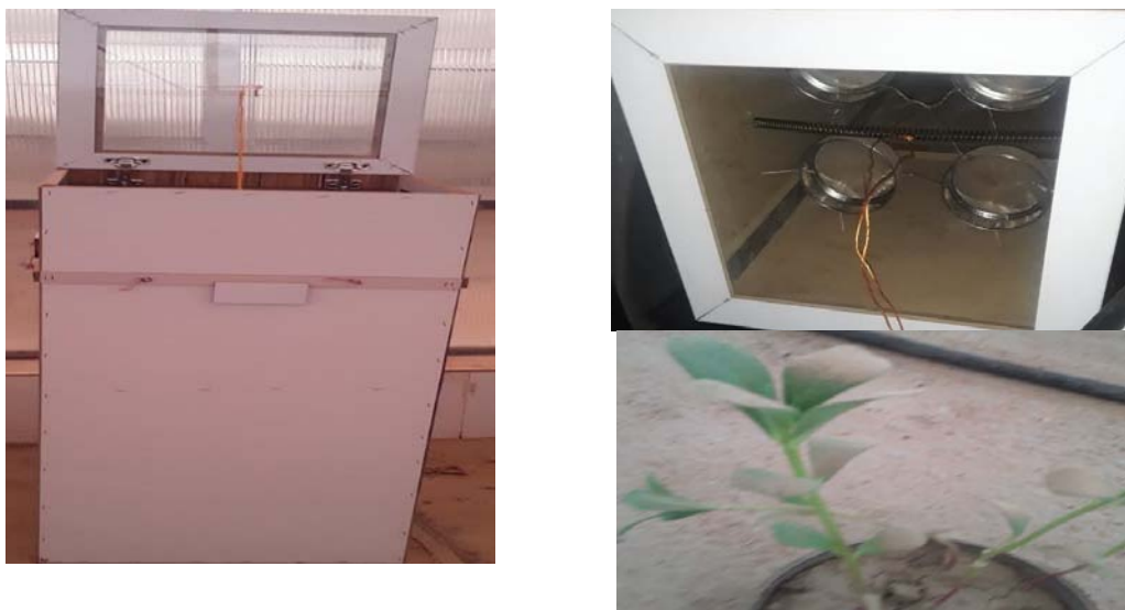
شکل ۱- اتاقک طراحی شده برای توزیع یکنواخت گرد و خاک به وسیله این اتاقک (چپ) و اعمال گرد و خاک بر روی اندام های هوایی علف هرز خرفه تابستانه (راست)