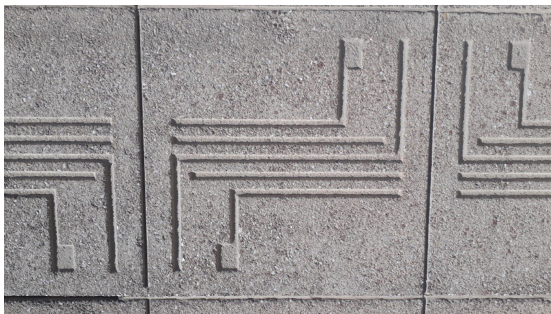
تصویر ۱. نمادواره مرکز اسناد و اطلاعات کشاورزی و منابع طبیعی حک شده بر روی دیوار ساختمان سازمان