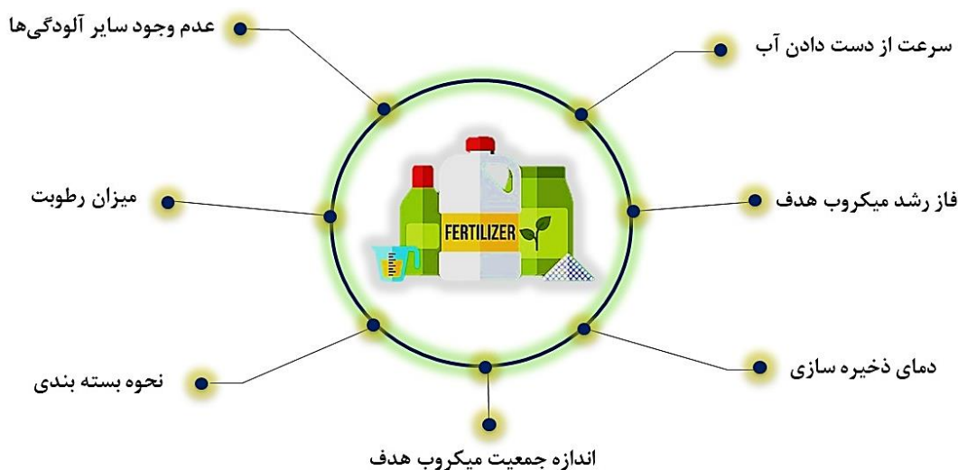
شکل ۲- عوامل تاثیرگذار بر کیفیت کودهای زیستی

یک عامل مهم در اجزای مایه‌تلقیح‌ها، درصد رطوبت حامل است برای مثال پیت غیراستریل برای ریزوبیوم‌ها تحت شرایط رطوبت بالا اثرات منفی بیشتری نسبت به پیت استریل دارد. به طوریکه محدوده رطوبتی برای پیت غیراستریل ۴۰٪ تا ۵۰٪ بوده ولی برای پیت استریل، رطوبت ۶۰٪ مناسب است. در مورد بسته‌بندی مایه‌تلقیح‌ها، معمولاً مواد پلی‌اتیلنی با چگالی بالا به کار می‌روند زیرا تبادل گاز و ورود اکسیژن