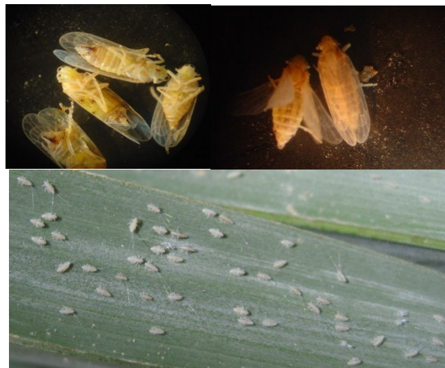
شکل ۱- حشرات کامل و پوره‌های زنجرک خرما (محمدی پور ۱۳۹۲).

Sadeghi & Pourmirza (2000) گزارش کردند که استفاده از تله‌های چسبنده یکی از ایمن‌ترین و کم‌هزینه‌ترین روش‌های مبارزه بر علیه آفات گلخانه است. بر همین اساس از تله‌های چسبنده برای مبارزه با حشرات کامل سفیدبالک ( Bemisia tabaci Gennadius (Hemiptera: Aleyrodidae: Aleyrodinae)) استفاده کردند. نتایج آن‌ها نشان داد که بین هفت رنگ آزمایش شده (سبز، زرد، نارنجی، قرمز، آبی، سیاه و سفید)، رنگ زرد از نظر میزان جلب حشرات کامل اختلاف معنی‌داری با سایر رنگ‌ها داشت. هم‌چنین بررسی تله‌های زرد چسبنده در سه ارتفاع ۰/۵، ۱ و ۱/۵ متری و فواصل ۰/۵، ۱ و ۱/۵ متری از بوته‌های پنبه نشان داد که در ارتفاع یک متری و فاصله ۰/۵ متری از بوته‌های پنبه، بیشترین قدرت جلب حشره وجود داشت. در تحقیقی کارایی تله‌های چسبنده با رنگ‌های مختلف در جلب کک چغندر ( Chaetocnema tibialis Illiger (Coleoptera: Chrysomelidae)) مورد بررسی قرار گرفت. بدین منظور، طی دو سال زراعی کارت‌های رنگی (زرد، سبز، قرمز، آبی، سفید و سیاه) بر پایه‌هایی در چهار ارتفاع (۰/۲۵، ۰/۵، ۱ و ۱/۷۵ متری) در حاشیه‌ی مزرعه چغندر نصب گردیدند. بر این اساس، در سال اول رنگ زرد از همه مؤثرتر بود. لذا، در سال دوم دو رنگ زرد لیمویی و زرد پررنگ مورد مقایسه قرار گرفتند. بیشترین میزان جلب کک چغندر C. tibialis مربوط به طیف زرد لیمویی و ارتفاع ۰/۲۵ متری بود با توجه به نتایج به‌دست آمده در این آزمایش، به منظور پیش‌آگاهی، از تله‌های چسبنده زرد لیمویی به ارتفاع ۰/۲۵ متر از سطح زمین در حاشیه‌ی مزرعه می‌توان استفاده نمود (Haqshana et al., 2008).