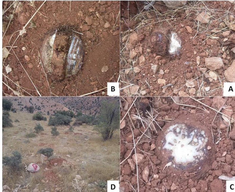
شکل ۲. تصاویری از انواع روش‌های برش: یک‌طرفه (A)، دو‌طرفه (B)، سنتی (C)، پوشاندن سطح ریشه پایه‌های گیاهی پس از برش (D) Figure 2. Different cutting techniques; Unilateral (A), Bilateral (B), Traditional (C), Covering surface plant roots after cutting (D)

پایان دوره بهره‌برداری گودال‌های حفرشده با خاک اطراف محدوده گودال برای حفاظت ریشه پایه‌های گیاهی پوشیده شدند (شکل، ۲ D).