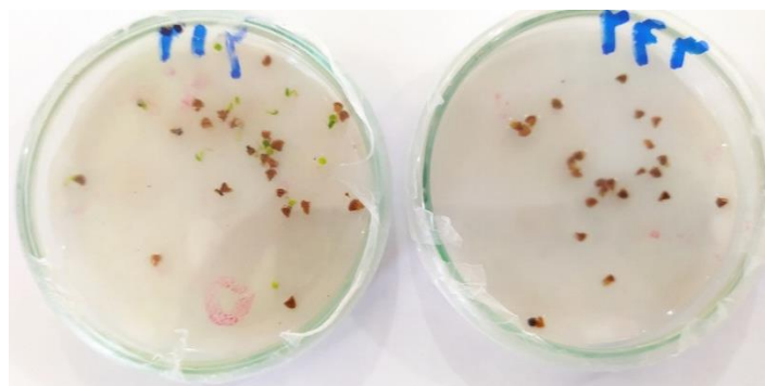
شکل ۱- اثر تنش شوری (۱۵۰ میلی مولار، راست) بر سرعت جوانه‌زنی بذور حنا در مقایسه با شاهد (صفر میلی مولار، چپ) در روز سوم آزمایش.

Figure 2- Effect of salinity stress (150 mM, right) on radicle and plumule length of Henna seedling compared to control (0 mM, left).