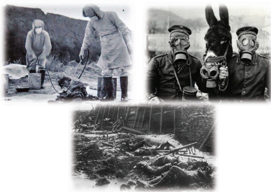
تصویر شماره ۳- استفاده از تسلیحات شیمیایی و بیولوژیک در طول دو جنگ جهانی.