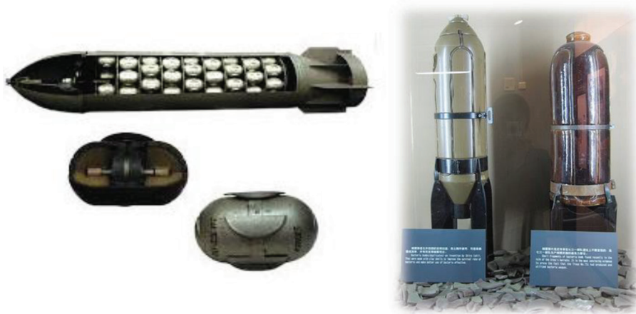
تصویر شماره ۲- نمونه‌های مهمات نظامی شیمیایی و بیولوژیک مورد استفاده در جنگ جهانی اول.

در ژوئن ۱۹۲۵ و در جریان برگزاری کنفرانس ژنو که در مورد نظارت بر تردد بین‌المللی تسلیحات برگزار شده بود، فرانسه پیشنهاد اضافه شدن منع استفاده از گازهای شیمیایی را مطرح و لهستان نیز اضافه شدن تسلیحات باکتریولوژیک را به این پروتکل پیشنهاد نمود. بدین ترتیب در ژوئن