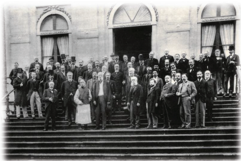
تصویر شماره ۱- نمایندگان کشورهای شرکت کننده در اولین کنفرانس بین المللی صلح هیگ (۱۸۹۹-هلند)(۳).

- گروه A، شامل پاتوژن‌های خطرناک برای امنیت ملی هستند که به راحتی منتشر شده و تلفات بالا را سبب می‌شوند. - گروه B، شامل عواملی هستند که با وجود انتقال نسبتا آسان، میزان مرگ و میر پایینی دارند. - گروه C، شامل پاتوژن‌های نوظهوری هستند که برای انتشار جمعی دستکاری شده‌اند که از خصوصیات آن‌ها می‌توان، آسانی تولید و انتشار، درصد بالای مرگ و میر را نام برد. همواره نوع بشر در جهت برتری و غلبه بر رقیب به دنبال استفاده از انواع تسلیحات حتی از نوع نامتعارف از جمله تسلیحات بیولوژیک بوده است. سابقه استفاده از میکروب‌ها یا توکسین‌ها به عنوان ابزاری جهت مبارزه یا حذف دشمن به ۷۰۰ سال پیش از میلاد مسیح بر می‌گردد. اما تا اواخر قرن نوزدهم هیچ گونه قانون یا عامل بازدارنده و توافق جهانی به منظور کنترل یا منع استفاده نامتعارف از عوامل بیولوژیک وجود نداشت و تنها در دو کنوانسیون صلح هیگ (تصویر شماره ۱) در سال‌های ۱۸۹۹ و ۱۹۰۷ ممنوعیت استفاده نظامی از عوامل شیمیایی تصریح شده بود لذا در سال‌های نخستین قرن بیستم قدرت‌های بزرگ جهانی در اروپا در حلاء ناشی از نبود سازوکار اجرایی و مقررات و قوانین بین المللی