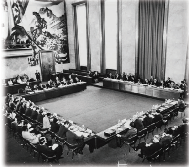
تصویر شماره ۴- نمایندگان کشورهای عضو کنفرانس کمیته خلع سلاح در حال مذاکره در سالن شورا واقع در مقر اروپایی سازمان ملل در ژنو سویس، سند کنوانسیون BWC در این سالن نهایی گردید (۴).

بدین ترتیب در آگوست ۱۹۷۱ آمریکا و شوروی به صورت جداگانه دو نسخه مستقل اما یکسان از پیش‌نویس یک کنوانسیون را روی میز کنفرانس کمیته خلع سلاح قرار دادند و مذاکرات میان دو ابر قدرت در سپتامبر ۱۹۷۱ به نتیجه رسید و مورد حمایت شرکت‌کنندگان در جلسه مجمع عمومی سازمان ملل قرار گرفت. این کنوانسیون در نهایت طی مراسم جداگانه در دهم آوریل ۱۹۷۲ در پایتخت‌های آمریکا، انگلستان و شوروی به عنوان هیات امنای کنوانسیون