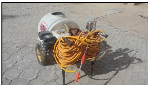
شکل ۲- سم‌پاش لانس‌دار کششی و سم‌پاش فرغونی مورد استفاده در این پژوهش Fig. 2- Trailed lance sprayer and wheelbarrow sprayer using in this research

سم‌پاش توربینی، پس از بهینه‌سازی و رفع عیب‌های آن، با دو سم‌پاش کششی و فرغونی لانس‌دار رایج در منطقه برای سم‌پاشی نخیلات (شکل ۲)، در سه تکرار ارزیابی شد. در هر آزمایش دو درخت و در مجموع شش