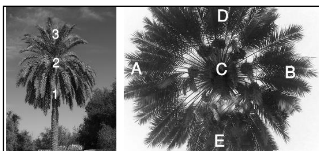
شکل ۳- آرایش کاغذهای حساس روی درخت

پس از سم‌پاشی، کاغذهای حساس جمع‌آوری شدند و به منظور تعیین قطر و تعداد قطره‌های سم،