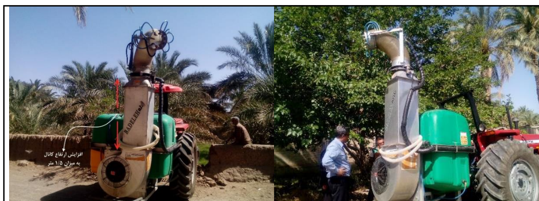
شکل ۱- سم‌پاش بهینه‌سازی شده برای درختان خرما

در مرحله دوم، تغییرات لازم به منظور بهینه‌سازی سم‌پاش به این شرح دنبال شد: سوار کردن مخزن سم‌پاش مخصوص نخلستان روی اتصال