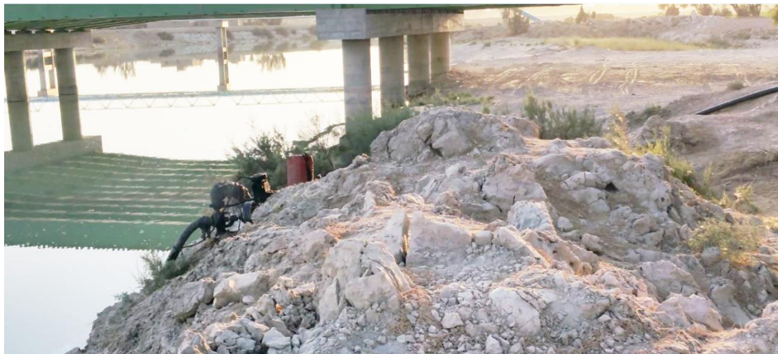
شکل ۲- نمایی از محل برداشت نمونه‌ها.