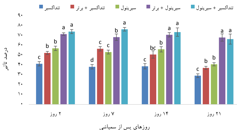
شکل ۲- میانگین درصد کاهش جمعیت ( \pm خطای معیار) لاروهای سوسک برگ‌خوار نارون تحت تأثیر حشره‌کش‌های گیاهی در روزهای مختلف بعد از سم‌پاشی در مرحله دوم محلول‌پاشی

ترکیب سیرینول + تنداکسیر و سیرینول + برتر در اولین تاریخ نمونه‌برداری، به ترتیب با ۷۴/۱۰ و ۷۱/۴۶ درصد کاهش جمعیت لاروها تفاوت معنی‌داری در درصد تأثیر نشان نداد (شکل ۲). همچنین در این تاریخ تیمار سیرینول با تیمار تنداکسیر + برتر اختلاف معنی‌داری در کاهش جمعیت لارو سوسک برگ‌خوار نارون نشان ندادند که بیانگر تأثیر بیشتر سیرینول نسبت به تنداکسیر + برتر است. یک هفته پس از محلول‌پاشی، تیمار سیرینول (۵۳/۲۴ درصد) به اندازه تیمار تنداکسیر + برتر (۵۶/۶۰) در کاهش جمعیت لاروها کارایی داشت (شکل ۲). اضافه کردن تنداکسیر و صابون محلول‌پاشی برتر به تیمار سیرینول به ترتیب با ۷۶/۴۲ و ۶۸/۳۸ درصد