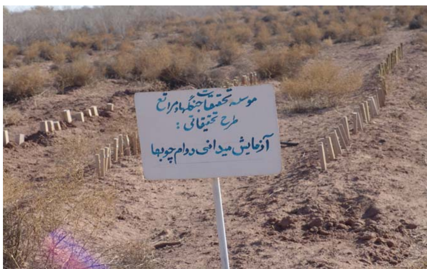
شکل ۳- نصب نمونه های آزمونی در خاک (ایستگاه میش مست)