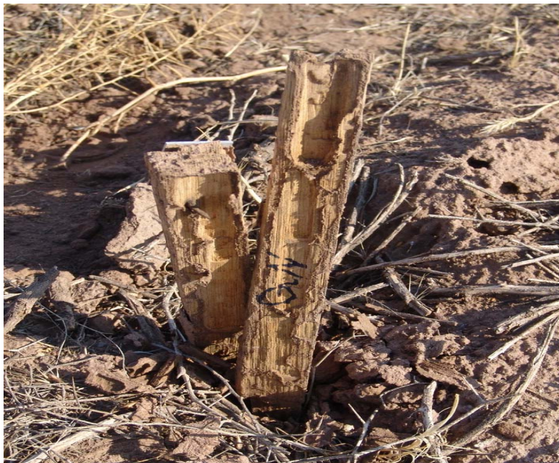
شکل ۶- تخریب قسمتهای داخل خاک و بیرون خاک بلندمازو (ایستگاه میش مست)