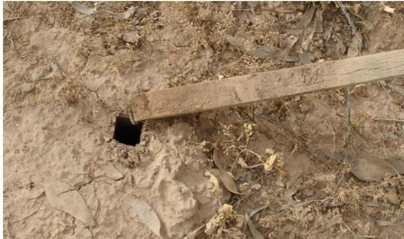
شکل ۱- خارج نمودن نمونه نصب شده به روش عمودی بدون تخریب محل نصب

نبودن، به راحتی در دسترس موریانه قرار دارد. ارزیابی نمونه‌های افقی مستلزم کندن زمین و تخریب کلنی موریانه می باشد. در روش نصب عمودی، حدود نصف