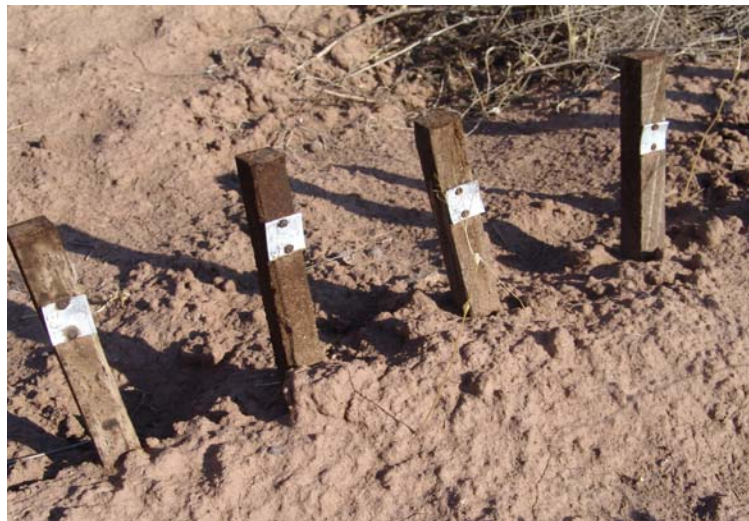
شکل ۷- عدم تخریب نمونه‌های اشباع شده (ایستگاه میش مست)