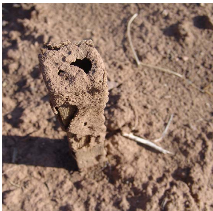
شکل ۵- ایجاد پوشش گلی بر روی نمونه‌ها جهت حفاظت در مقابل نور