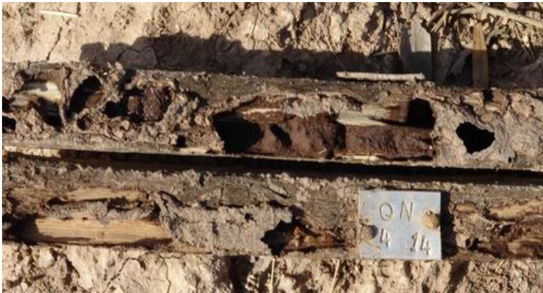
شکل ۴- تخریب نمونه‌های دوام طبیعی بلندمازو پس از ۱۵ ماه استقرار در خاک (ایستگاه الباجی)

در مردادماه (فصل بسیار گرم) سال بعد انجام شد. قسمت داخل به طور کامل تخریب شد و قسمت بیرون بیشتر نمونه‌ها به طور کامل به وسیله گل پوشانیده شده بود (شکل شماره ۵) و مورخانه‌ها از سطح و داخل به شدت در حال تخریب نمونه‌ها بودند (شکل ۴). در ایستگاه میش مست اولین ارزیابی پس از ۶ ماه انجام شد که آثار فعالیت مورخانه‌ها مشخص بود. پس از ۱۵ ماه به درجه تخریب ۴ و پس از ۱۹ ماه کاملاً تخریب شد (جدول شماره ۶). هیچ یک از نمونه‌های اشباع شده در دو ایستگاه میش مست و الباجی تخریب نشدند (شکل ۷).