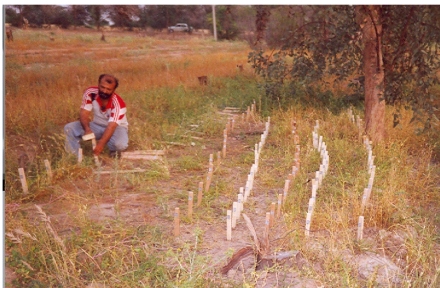
شکل ۲- نصب نمونه های آزمونی در خاک (ایستگاه الباجی)