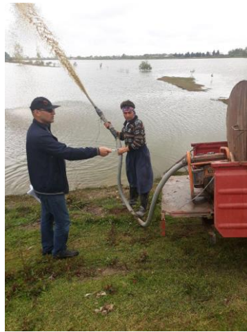
شکل ۲- پخش شیرابه کود گاوی در سطح استخر