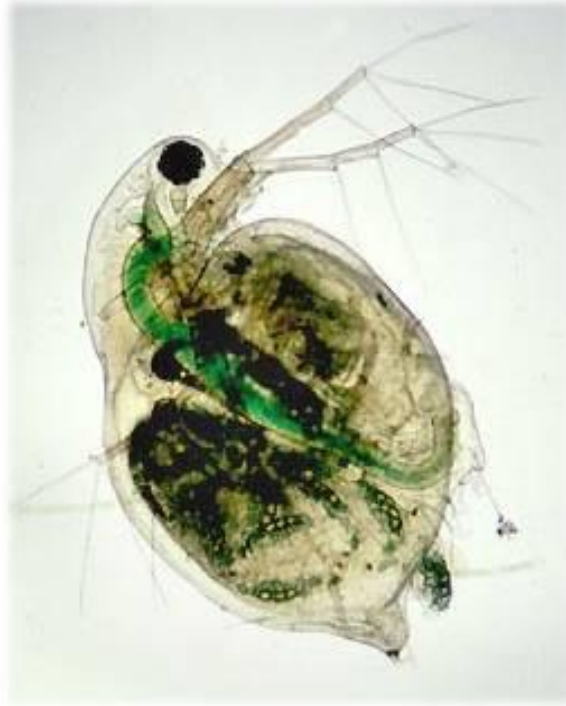
شکل ۳- دافنی (برگرفته از اینترنت)

در بررسی آب به منظور شناسایی فیتوپلانکتون، تعدادی فیتوپلانکتون بعنوان شاخص های آب غنی شده مشاهده شد که در ذیل به آنها اشاره می شود: