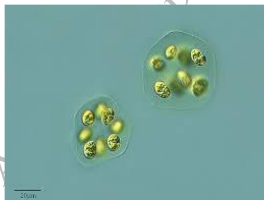
شکل ۵- Oocystis

این جنس دارای سلولهای بیضوی یا لیمویی شکل با طول ۲۰-۵ میکرون و عرض بین ۱۳-۹ میکرون بودند. در بعضی موارد گاهی ۲ یا چند سلول با یکدیگر در داخل یک سلول مادر قرار گرفته بودند.