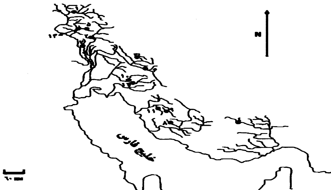
شکل ۱: موقعیت ایستگاههای نمونه برداری در حوضه دجله و خلیج فارس

- اطلاعات مربوط به مشخصات بعضی از ایستگاهها بدست نیامد.