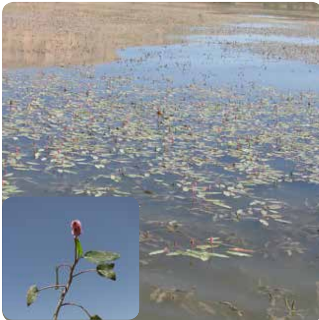
شکل ۴- گونه Polygonum amphibium پراکنده در سطح تالاب چغاخور