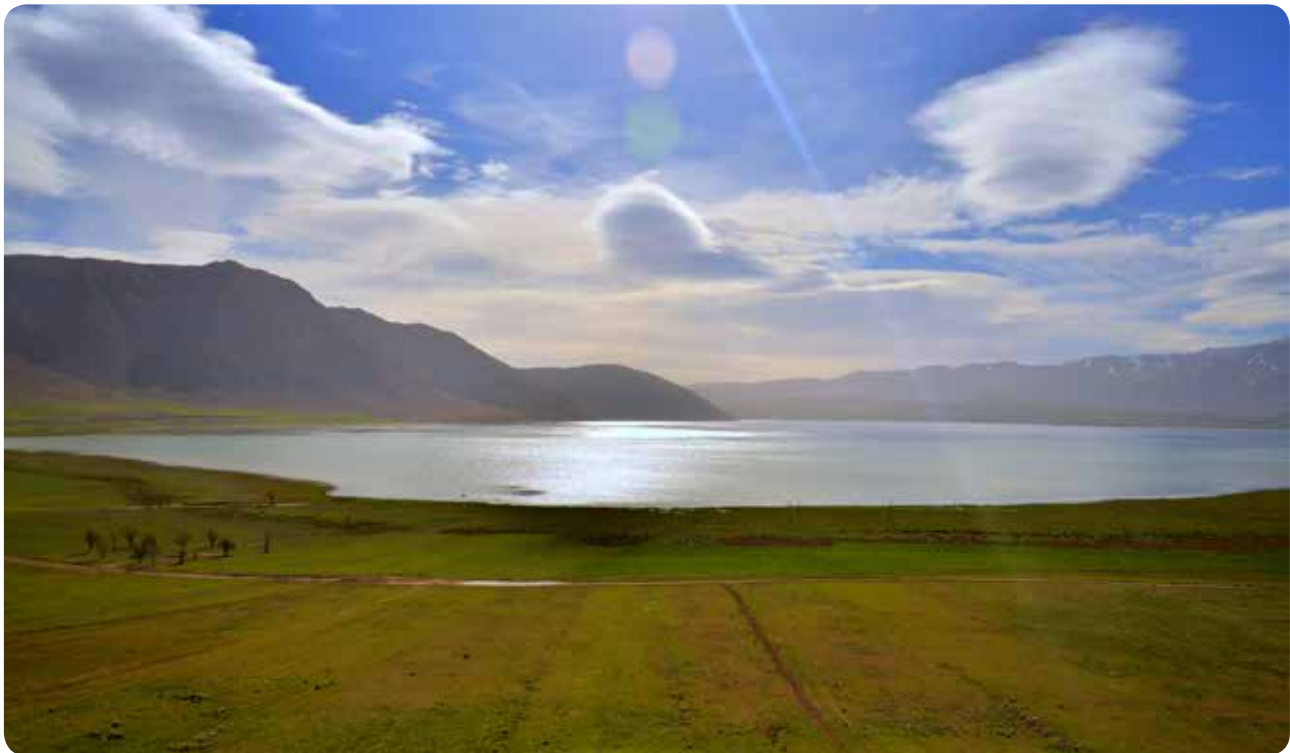
شکل ۱- نمایی زیبا از تالاب بین‌المللی چغاخور

تالاب چغاخور با وسعت ۱۵۰۰ هکتار در فاصله ۲۰ کیلومتری بروجن و نزدیکی شهر بلداجی قرار گرفته و یکی از زیباترین و بزرگ‌ترین تالاب‌های استان چهارمحال و بختیاری است. این تالاب بین عرض‌های جغرافیایی ۳۱ درجه و ۵۴ دقیقه و ۱۷ ثانیه تا ۳۱ درجه و ۵۶ دقیقه و ۳۱ ثانیه شمالی و طول‌های جغرافیایی ۵۰ درجه و ۵۲ دقیقه و ۴۰ ثانیه تا ۵۰ درجه و ۵۶ دقیقه و ۱۴ ثانیه شرقی واقع شده است. ارتفاع از سطح دریا در محدوده تالاب بین ۲۲۷۵ تا ۲۳۰۰ متر است. مساحت دریاچه تالاب از ۱۳۶۰ هکتار قبل از احداث سد روی آن به حدود ۲۳۰۰ هکتار بعد از ساخت سد افزایش یافته است. مساحت منطقه شکار ممنوع تالاب نیز حدود ۲۵۰۰ هکتار است (شکل ۲).