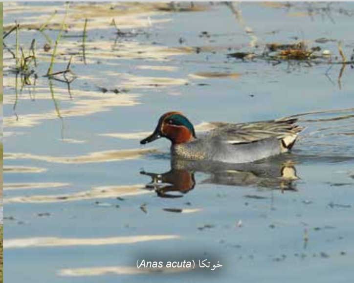
خو تکا ( Anas acuta )

ادامه شکل ۵- نمونه‌هایی از پرندگان تالاب چغاخور