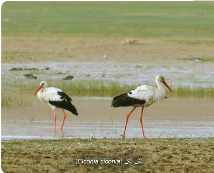
لک لک ( Ciconia ciconia )