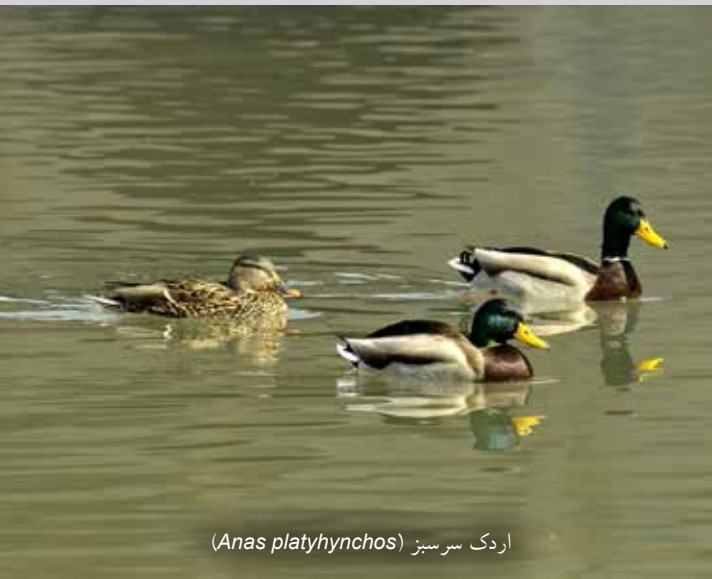
اردک سرسبز ( Anas platyhynchos )