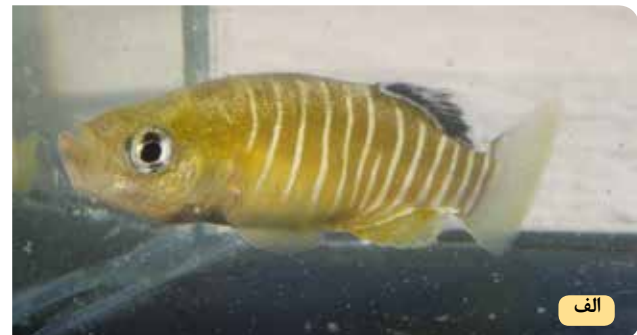
شکل ۶- ماهی گورخری Aphanius vladykovi نر (الف) و ماده (ب) (حداکثر اندازه استاندارد ۵۰ تا ۶۰ میلی‌متر)