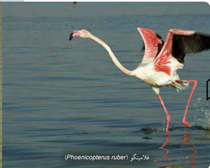
فلامینگو ( Phoenicopterus ruber )