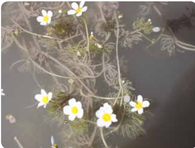
شکل ۳- گونه آلاله آبی Batrachium trichophyllum