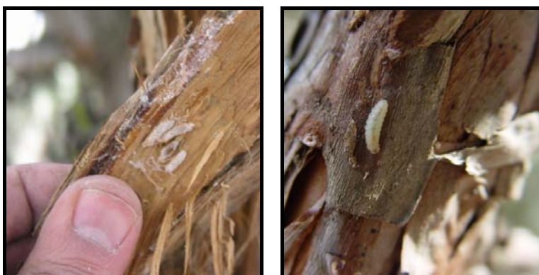
شکل ۴- لارو سن آخر (راست) و پیش شفیره آفت در زیر پوستک درختان میزبان (چپ) (اصل)

براساس اطلاعات جمع‌آوری شده از نمونه‌برداری‌های ۳ ساله، دوره زندگی پروانه میوه‌خوار ارس روی درخت ارس در منطقه طارم استان قزوین مطابق جدول ۱ می‌باشد.