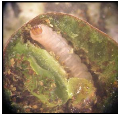
شکل ۲- لارو شب‌پره Argyroresthia praecocella در حال تغذیه از گوشت میوه (اصل)