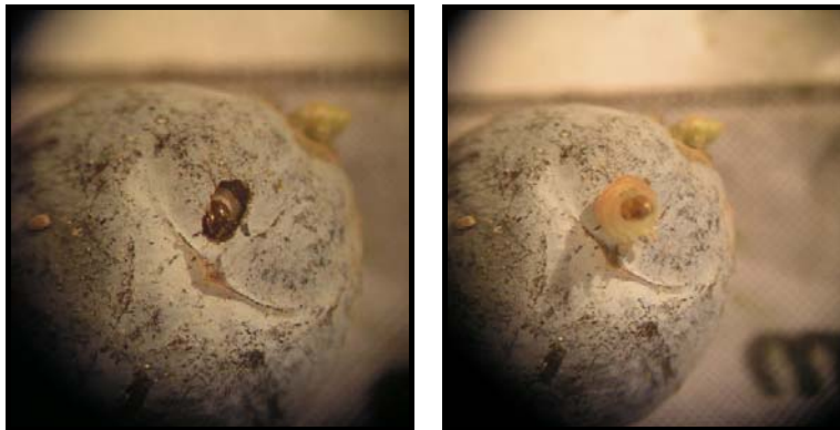
شکل ۳- سوراخ خروجی لارو سن آخر (راست) و لارو کامل در حال خروج از میوه (چپ) (اصل)