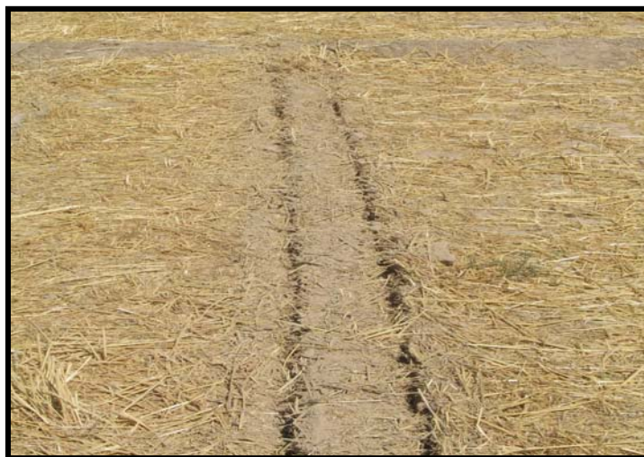
شکل ۳- شیار ایجاد شده با شیار بازکن دوتایی در حالتی که چرخش صفحه برش در خلاف جهت چرخ‌های تراکتور باشد.

این امر در زمانی که حرکت صفحه برش در جهت حرکت چرخ‌های تراکتور است به علت حرکت از بالا به پایین دندان‌ها و وجود نیروهای مقاومت برشی منجر به برش قطعات به جای کنده شدن آنها می‌شود و کاهش قابل توجهی را در این شاخص باعث شده است. مشاهدات مزرعه همچنین نشان داد که چرخش صفحه برش در خلاف جهت پیشروی به بریدن بهتر بقایا کمک می‌کند.