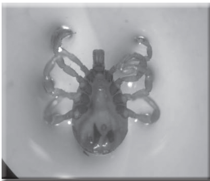
تصویر ۱- کنه H. anatolicum

شهرستان شهرکرد مورد بررسی قرار دادند (۱۰). دهقانی و همکاران در بررسی خود در شهرستان کاشان فراوان‌ترین کنه جمع‌آوری شده را هیالوما گزارش کرده‌اند (۷). در حالی که فشارکی در سال ۱۳۷۷ جمعیت این کنه‌ها را در منطقه قم کم می‌شمارد (۵). حقوقی و همکاران ۸۳ درصد کنه از جنس هیالوما را در گاوهای اهواز جدا نمودند (۷). توکلی و همکاران نیز در مطالعات خود در استان لرستان ۷ گونه کنه از جنس هیالوما را شناسایی کرده‌اند (۴). رزمی نیز از میان گاوهای مشکوک به تیلبوز در مشهد بیشترین کنه جمع‌آوری شده را هیالوما گزارش نموده است (۸). در بررسی‌هایی که یخچالی و همکاران در دامداری‌های اطراف شهرستان اشنویه انجام دادند گونه‌های متنوعی از کنه هیالوما را مشاهده کردند (۱۵). Kady در سال ۱۹۹۸ این کنه را از شترهای مصر جدا نموده و آلودگی آن را به اسپورو بلاست تیلبریا نشان داده است (۱۸). Diab و همکاران در سال ۱۹۹۹، ۶ گونه و زیر گونه هیالوما را در شترهای مصر شناسایی کردند (۱۶). Mazyad نیز در سال ۲۰۰۱ وجود آلودگی به H. anatolicum و H. dromedarii را در شترهای مصر گزارش کرد (۲۰).