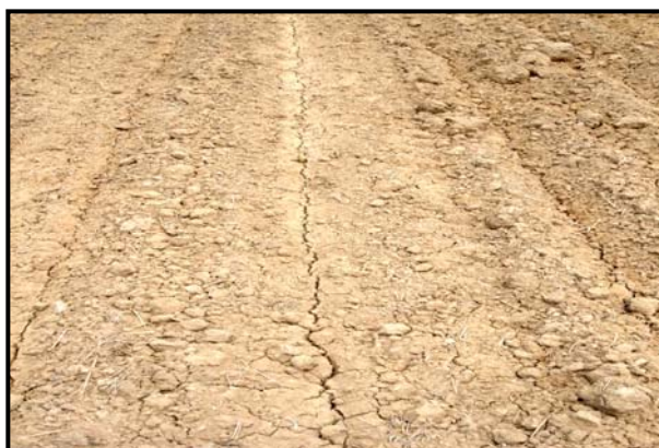
شکل ۶- ایجاد ترک در ۹۶ درصد طول خطوط کاشت