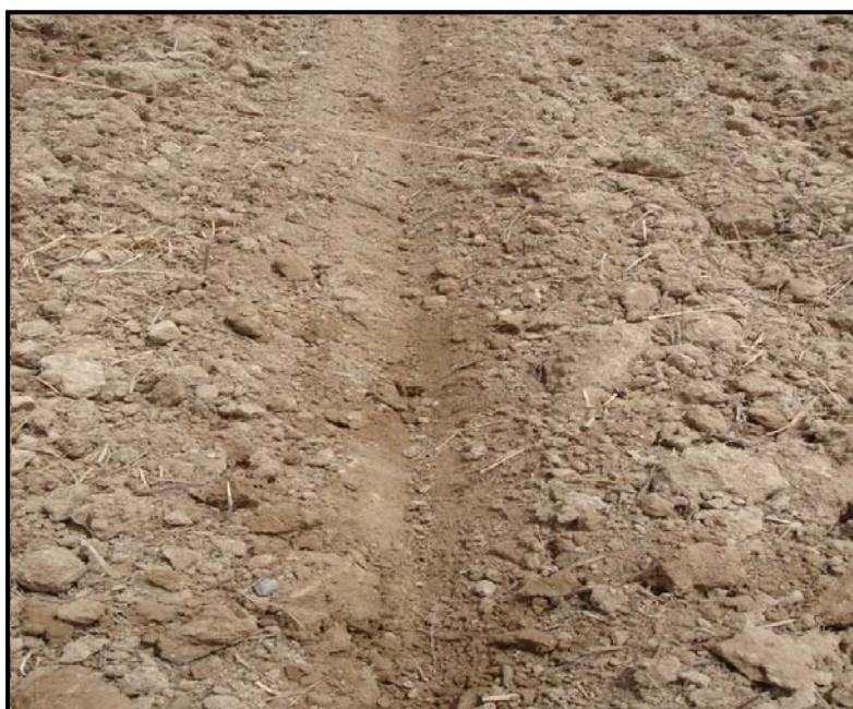
شکل ۳- ایجاد شیار در محل خطوط کاشت در ردیف‌کار مجهز به چرخ‌های فشار مخروطی

شکل‌دهی خاک با چرخ‌های فشار مخروطی، اگرچه گودی‌های مورد نظر را در محل خطوط کاشت ایجاد کرد ولی سبب جابه‌جایی خاکی شد که در آن بذر پنبه کشت شده بود. جابه‌جایی بذر به سمت کنار و بالای خطوط کاشت (ترک‌های طولی ایجاد شده) امکان حرکت گیاهچه به سمت ترک‌ها و خروج آن را فراهم نمی‌ساخت. از این‌رو، استفاده از یک عامل جویچه‌ساز قبل از شیار بازکن که قادر به شکل‌دهی اولیه خاک باشد مورد بررسی قرار گرفت (شکل ۵). در این حالت، چرخ‌های فشار مخروطی تنها وظیفه تثبیت شیارهای ایجاد شده و نه شکل‌دهی خاک را بر عهده داشتند. به منظور ایجاد شیارهایی به عمق حداکثر ۵ سانتی‌متر محل قرارگیری عامل جویچه‌ساز نسبت به شیار بازکن ماشین کاشت با آزمون‌های مزرعه‌ای تعیین شد. ردیف‌کار مجهز به عامل