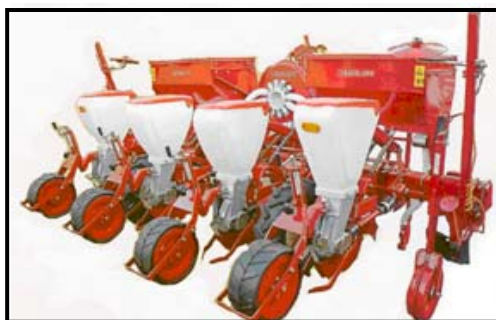
شکل ۱- نمایی از ردیف‌کار استفاده شده در آزمایش