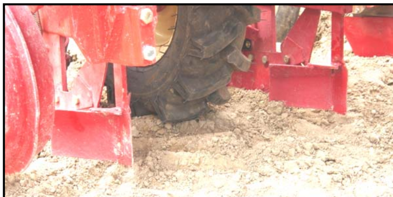
شکل ۵- استفاده از عامل جویچه‌ساز قبل از شیار بازکن ماشین کاشت جهت ایجاد شیار