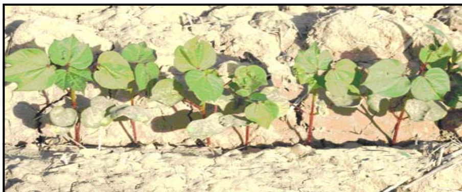
شکل ۷- سبز شدن گیاهچه‌ها از ترک‌های طولی ایجاد شده در تیمار B در منطقه ورزنه