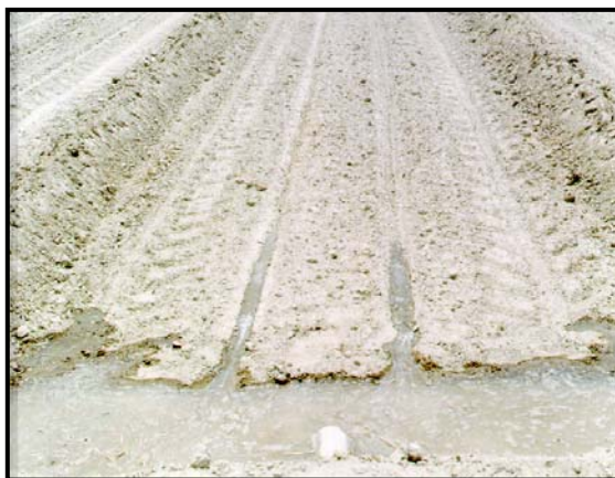
شکل ۴ - جویچه‌های آرامش آب جهت آبیاری